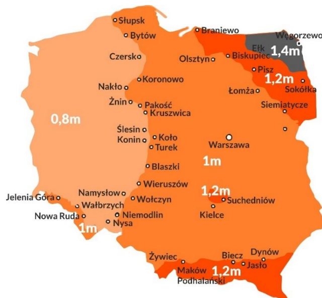
Rys. 1. Głębokość przemarzania gruntu wg PN-81/B-03020.

W wypadku, gdy w podłożu występują grunty wysadzinowe lub wątpliwe, należy sprawdzić, czy rzeczywista grubość wszystkich warstw zaprojektowanej konstrukcji nie jest mniejsza niż 0,4 h, gdzie h oznacza głębokość przemarzania gruntów w rejonie projektowanej konstrukcji (Rys.1). Jeżeli warunek ten nie jest spełniony, to pod konstrukcją należy wykonać warstwę mrozochronną o grubości zapewniającej spełnienie tego warunku.